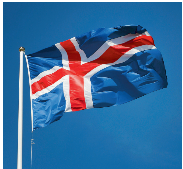
Die isländische Flagge