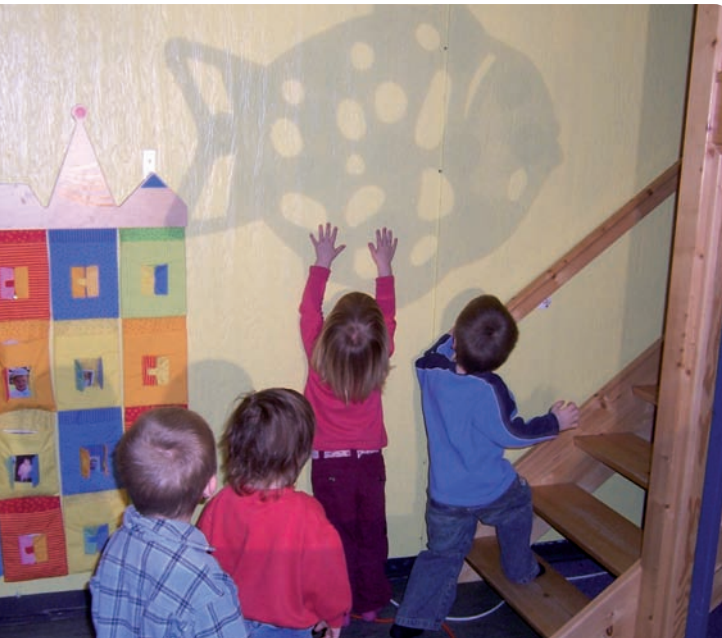
Krippen Kinder fangen einen Fisch.

Die Kinder starren den großen Fisch an der Wand an und sagen kein Wort. Dann, auf einmal kommt Leben in sie.