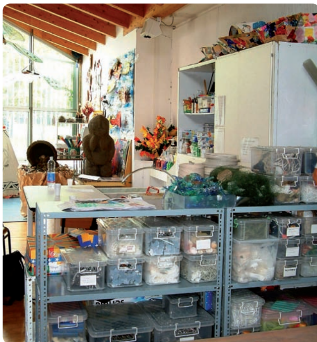
Atelier in Reggio

Für die kreative Umsetzung der Projekte brauchen die Beteiligten neben einer Vielzahl von Materialien auch einen Raum, der zugleich Arbeits- wie auch Aufbewahrungsraum ist. Das Atelier (Werkstatt) ist neben der piazza das Herzstück der Kitas in Reggio. Das, was die mini-ateliers für die Gruppenräume sind, ist das Atelier für die gesamte Kita. Es ist der Raum in der Kita, in dem jederzeit und ohne Einschränkung künstlerisch gearbeitet werden kann. Hier gibt es Arbeitstische, Werkzeuge, Staffeleien, Platz für größere Bauwerke, Regale voll sichtbarer Materialien wie Wolle, Fell, Plastik, Ton, Steine, außerdem alle Sorten von Stiften, Pinseln, Farben und Werkzeuge, schließlich Schränke mit verschiedenen Papiersorten. In dem Raum kann mit Kleingruppen gearbeitet werden, er dient aber auch als Lager für die mini-ateliers .