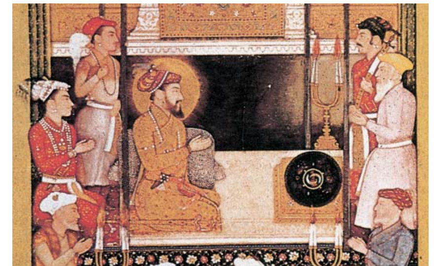
Der Mogul-Herrscher in seinem Palast in der Hauptstadt Delhi (Miniatur, 18. Jh.)

1857/58 wehrten sich die Inderinnen und Inder unter der Führung des Moguls in einem großen Aufstand gegen die englischen Kolonialherren – aber ohne Erfolg. 1874 ließ sich die britische Königin Victoria zur „Kaiserin von Indien“ krönen. Indien war zur wichtigsten Kolonie im britischen Weltreich (Empire) geworden. Verwaltet wurde Indien von englischen Beamten. Englische Richter sprachen Recht nach englischem Gesetz.