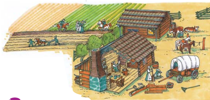
Die ersten Behausungen waren Hütten aus Lehm oder Baumstämmen. Diese ersten kleinen Dörfer wuchsen im 19. Jahrhundert zu großen Städten wie Baltimore, Chicago, San Francisco oder New York.

1? Nennt Gründe für die Auswanderung aus Europa. Welche Auswirkungen hatte die Besiedelung für die Urbevölkerung?