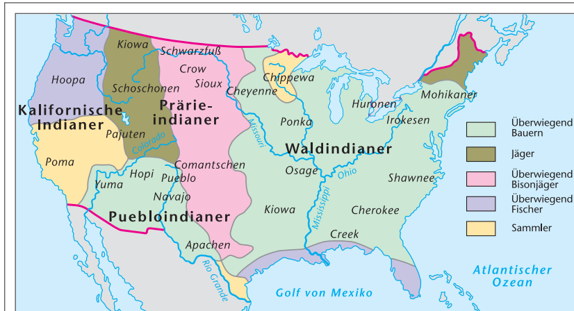
Nordamerika, bevor die Europäer kamen